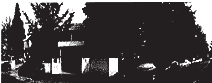
Tabella 1.1 – Anagrafica della scuola