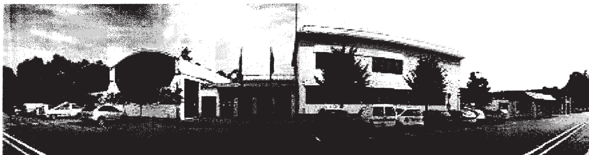
Tabella 1.1 – Anagrafica della scuola